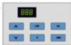
Panel de control