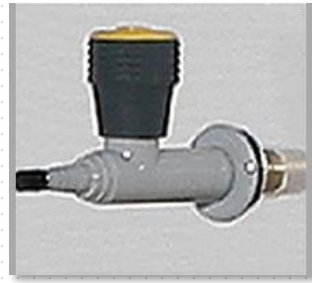
LLAVE PARA GAS