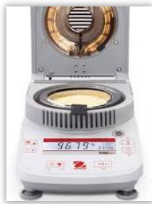
Elemento de calentamiento infrarrojo.