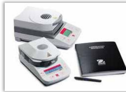
Pequeña superficie de operación, para colocarse sobre cualquier mesa.